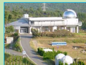
美星天文台 101cm 望遠鏡で天体観測