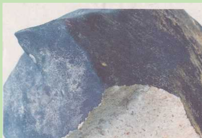
国分寺隕石 7kgの断面