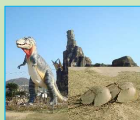
笠岡市立 カブトガニ博物館