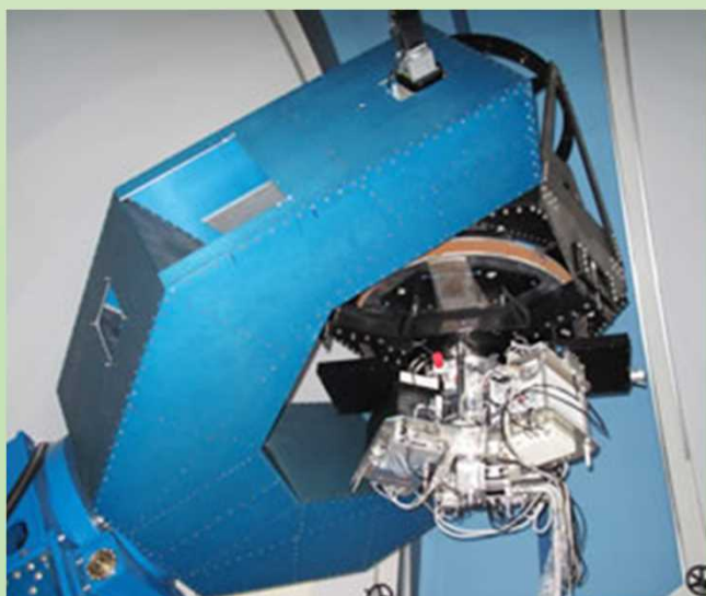
美星スペースガードセンター口径1.0m望遠鏡