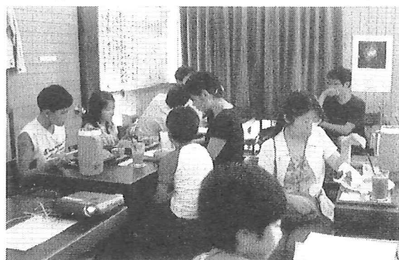
図2 美星サイエンスカフェの会場の様子

2007年11月に第一回目を開催して以降、夏・冬の年2回定期開催している。講演は2回それぞれ30分程度とし途中の休憩時間を含め全体で90分程度である。内容はスペースガード関連のものを中心として宇宙に関するものとしBSGC観測者が講演を行う。地域の飲食店の一角を会場(定員20名程度、図2)としている。参加者は毎回15～20名程度で2011年11月までにのべ125名の方の参加があった(図3)。毎回実施しているアンケートと参加者の直接の感想から講演内容、イベントの雰囲気についてはおおむね良好である。